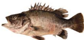
Poliprion americanus Chernia