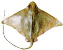
Myliobatis goodei Chucho