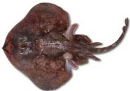
Psammobatis normani Raya