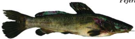
Rhandia quelen Bagre Sapo