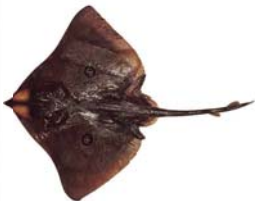
Atlantoraja cyclophora Raya de circulos