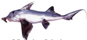
Callorhynchus callorhynchus Pez gallo